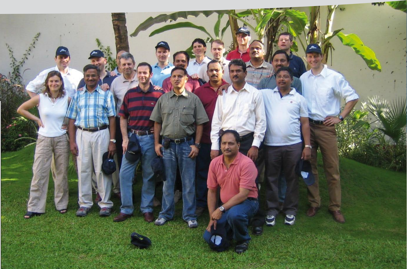
Die Teilnehmer des Management-Trainings.